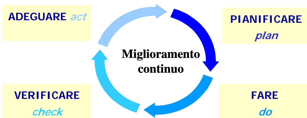
Figura 7.1 - Schema generale del SGA

La metodologia PDCA, nell’ottica del miglioramento continuo, può essere sintetizzata come segue: