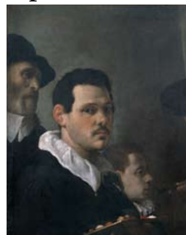
Annibale Carracci Autoritratto, Milano Pinacoteca di Brera