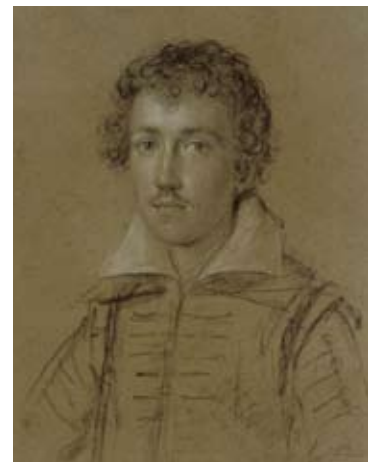
Ottavio Leoni Ritratto di Ferdinando Gonzaga, Berlino, Preussischer Kulturbesitz, Staatliche Museen, Kupferstichkabinett